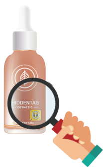
肉眼 検証 (ラベル、デザイン)