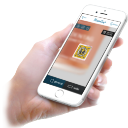
アプリを通した検証 (ラベルデータ検証)