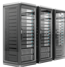
サーバモニタリングを通した検証 (ユーザーGPS、認識回数、認識パターン)