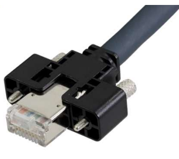
スクリューロック (GigE Vison用)