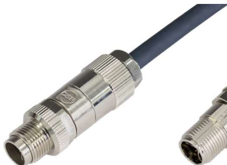
M12Xプラグ (日本製線 (NS))