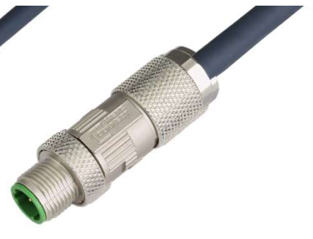
M12Dプラグ (Mets Connect)