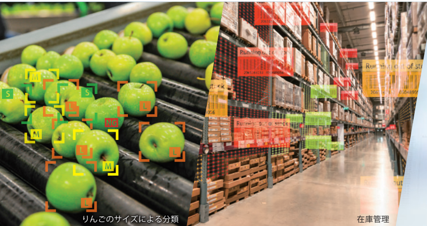
りんごのサイズによる分類